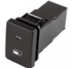
■ビルトインスイッチ

⚠ 車種によっては複数のタイプが適合します。 上記ご参照の上、販売店様の販売方針やユーザー様のご希望に沿ったタイプをお選びください。