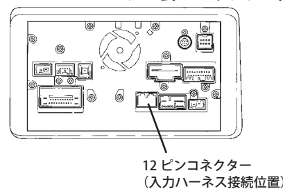
VHI-H41 モニター裏 コネクター図

モニター裏に車両側ハーネスが入っているので、VHI-H41 をモニターと車両側ハーネスの間に接続します。