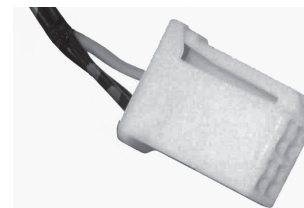
車両側カメラコネクタ(4ピンコネクタ)

本製品は、モニター(ナビゲーション)裏側にある既設のカメラコネクタ(4ピンコネクタ)に接続します。(下図参照)