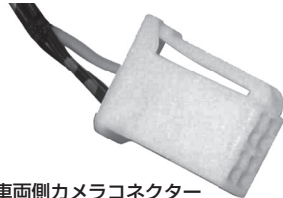
車両側カメラコネクター (4ピンコネクター)

4. 接続概要図を参考に、本製品から出ている3本の配線、黄色ピンプラグを接続します。