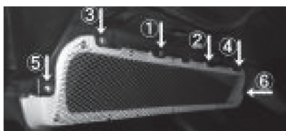
付属のビスとワッシャーを使用し、しっかりと固定してください。

※必ず上記の方法で本締めをおこなってください。この取り付けを怠ると、本製品のゆがみ、割れなどが起こる場合があります。