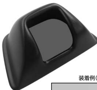
装着例(ボディ色塗装済み)