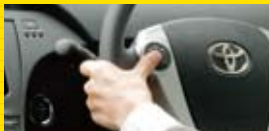
ステアリングスイッチを操作

市販ナビを装着しても純正ステアリングスイッチで、テレビ・ラジオ選局/CD・HDDオーディオ選曲/DVDのチャプター選択/ボリューム調整/ナビの現在地表示などを自在にコントロールすることができます。